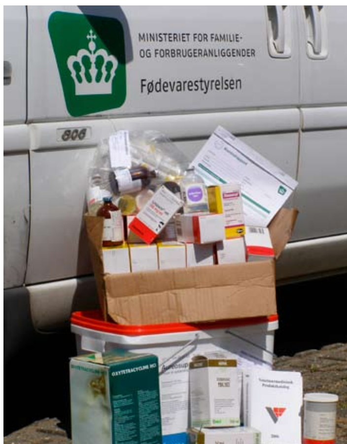
Ulovlig opbevaring og anvendelse af medicin betragtes som en alvorlig overtrædelse. Billedet viser en beslaglæggelse foretaget af Medicinrejseholdet.