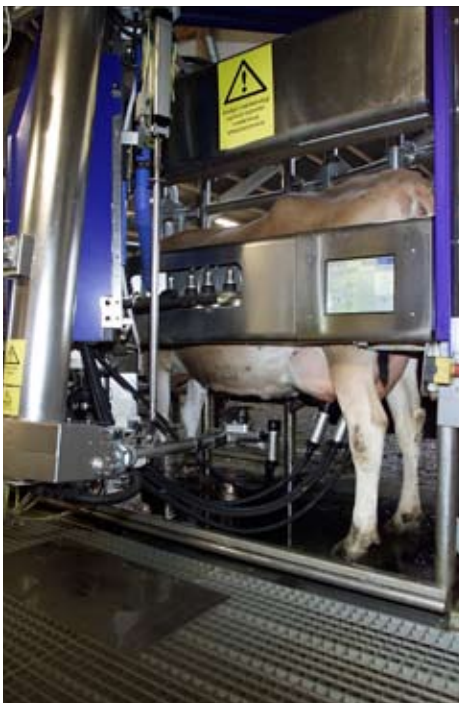
Forsøg, foretaget på Kvægbrugets Forsøgscenter viser, at laktationsydelsen for en SDM-ko kan øges med 1.500 kg ved hjælp af individuel fodring.

I det aktuelle tilfælde var vægtene placeret under malkebobotterne. Når køerne begyndte at tage på i vægt efter mobiliseringsperioden, blev den energirige grundration udskiftet med en energisvag, og samtidigt blev køerne tilbudt ekstra 3 kg kraftfoder i malkebobotten. De ekstra 3 kg kraftfoder blev gradvist fjernet, efterhånden som køerne tog yderligere på i vægt. Når køerne havde opnået en tilvækst på 50 kg i forhold til vægtminimum, var de tilbage på basistildelingen på 3