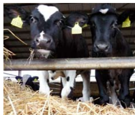
Slagtekalveproducenterne mister koncepttillægget, hvis kalvene er så små ved levering, at de ikke opnår den nødvendige slutvægt.