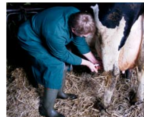
Yverbetændelse forårsaget af B-streptokokker kan være meget smitsom og betyde store økonomiske tab.

Hvis en besætning har B-streptokokker, er det som ved andre smitsomme yverlidelser meget vigtigt at nedsætte smittepresset. Man skal kontrollere malkning og malkeanlæg. Bruge pattedyr med virksom desinfektion – altså jod. Goldbehandle de inficerede køer. Bruge handsker. Sektionere eller holdopdele. Hvis det er