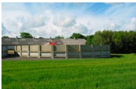
De nye regler skal bl.a. forbedre sikkerheden omkring gyllepumper.

Ifølge Miljøstyrelsen vil der på et senere tidspunkt komme krav om gyllebarrierer. Miljøsty-