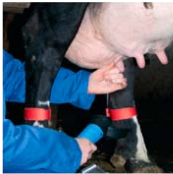
Korrekt mærkning er en af de vigtigste måder at undgå antibiotika i mælken.

Det bratte fald kom i umiddelbar forlængelse af orienteringen i