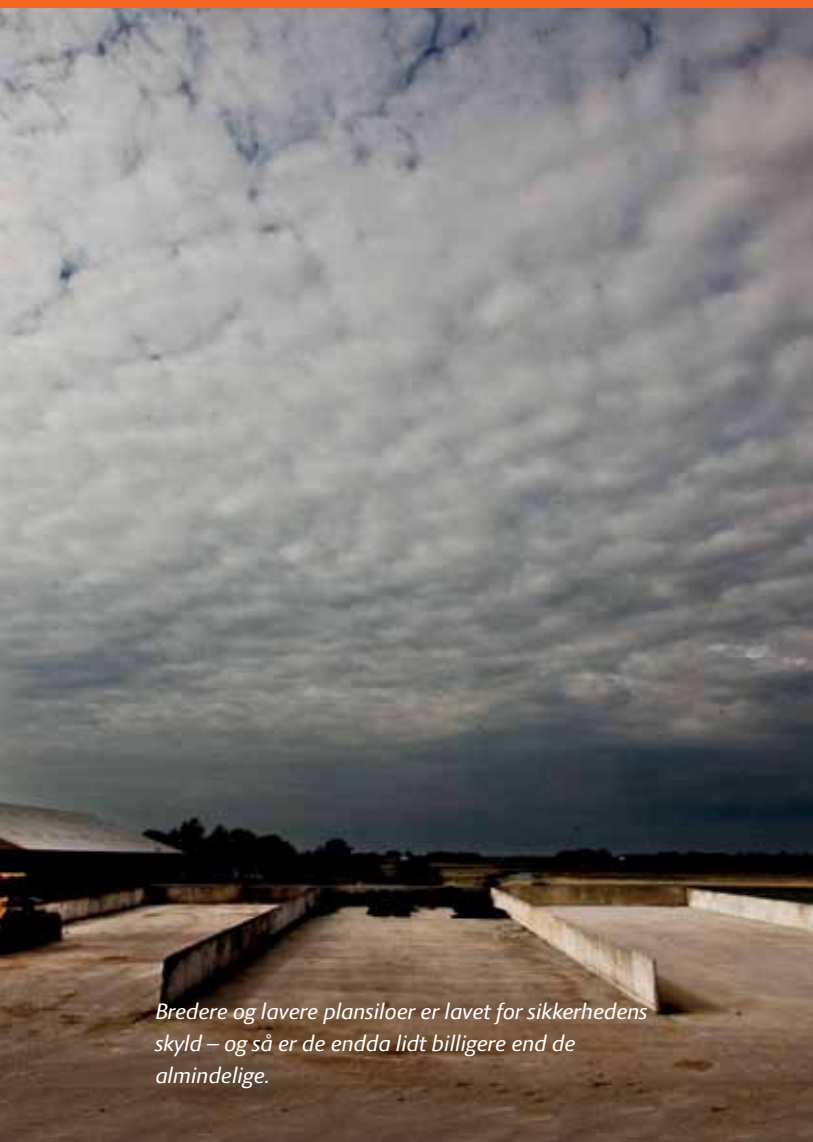
Bredere og lavere plansområder er lavet for sikkerhedens skyld – og så er de endda lidt billigere end de almindelige.