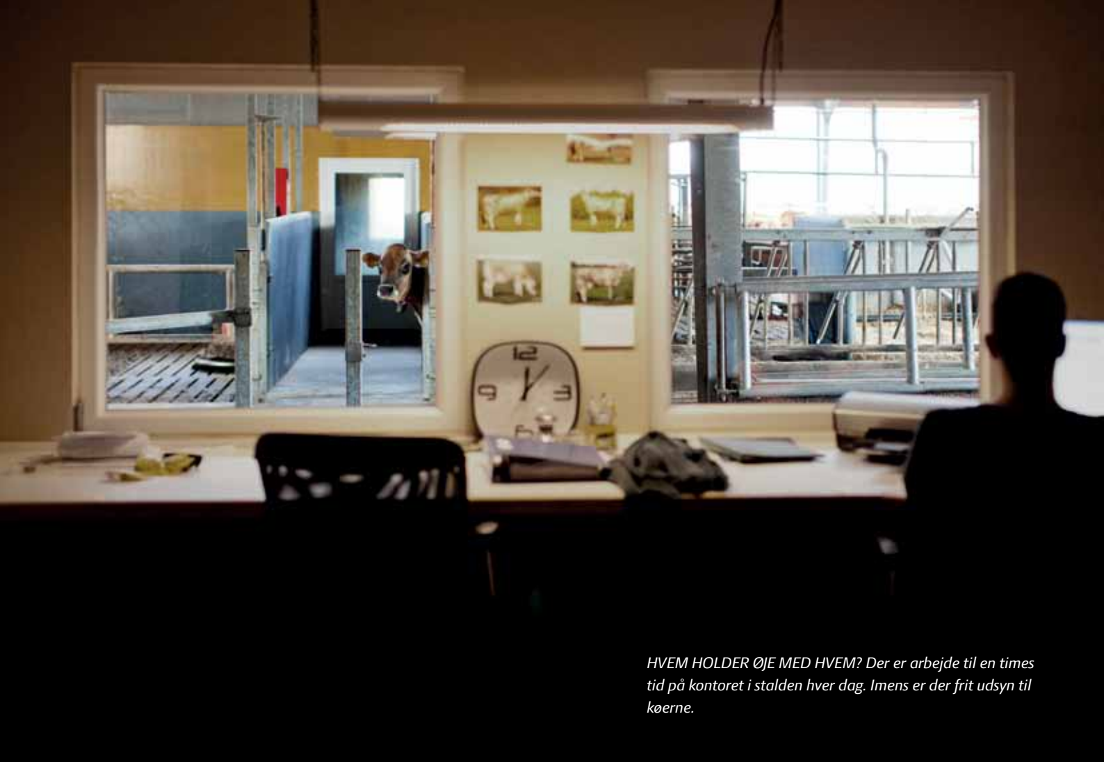
HVEM HOLDER ØJE MED HVEM? Der er arbejde til en times tid på kontoret i stalden hver dag. Imens er der frit udsyn til køerne.